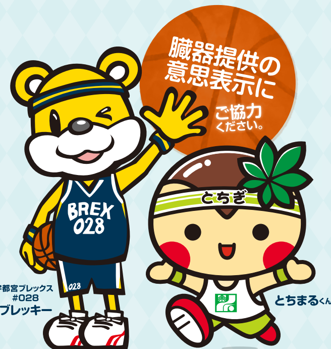
宇都宮ブレックス #028 ブレッキー