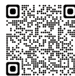
難病患者 在宅レスパイト事業

※医療的ケアを受けている方が 20歳未満 である場合は「医療的ケア児等在宅レスパイト事業」をご覧ください。