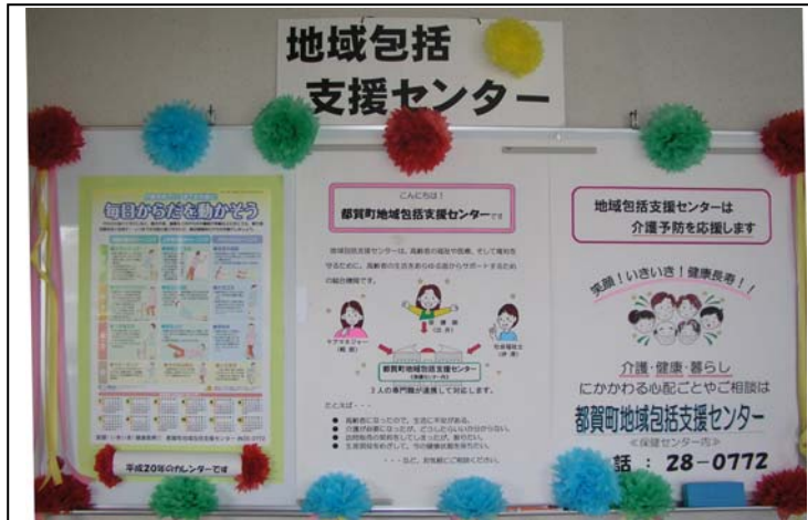
《地域包括支援センター掲示板》