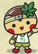
栃木県マスコット キャラクター とちまるくん