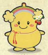
栃木県 老人福祉施設協議会 イメージキャラクター とちぶくちゃん