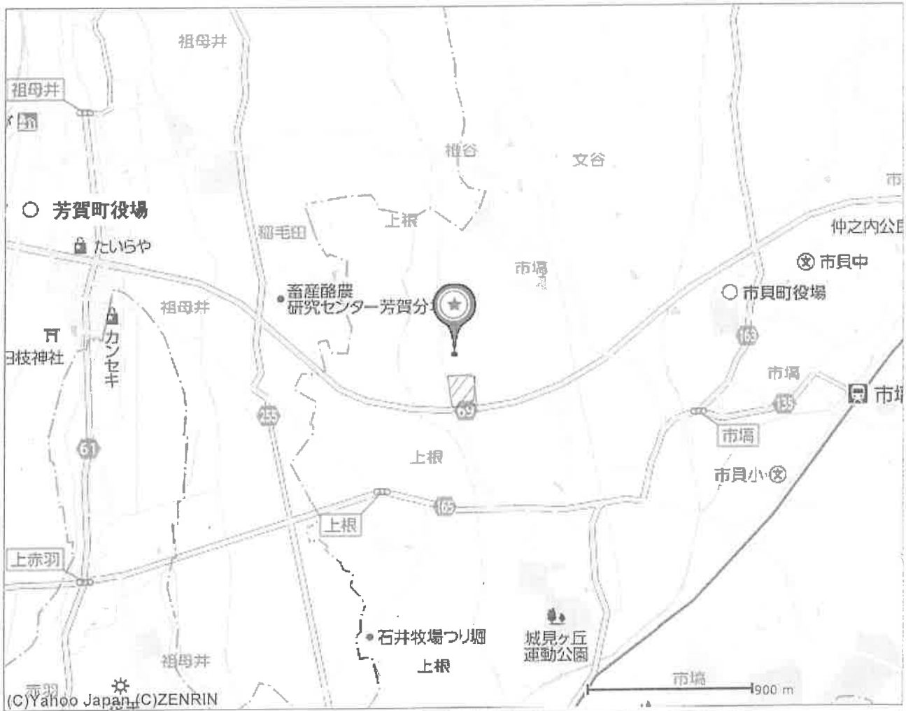
栃木県芳賀郡市貝町大字上根周辺の地図