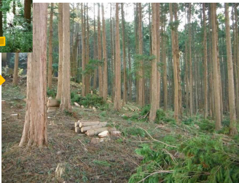
整備後 間伐された林内