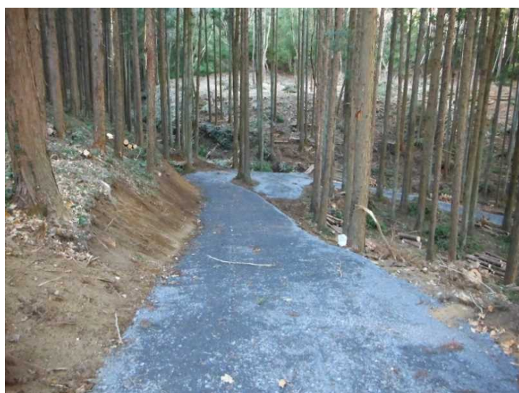
整備された遊歩道