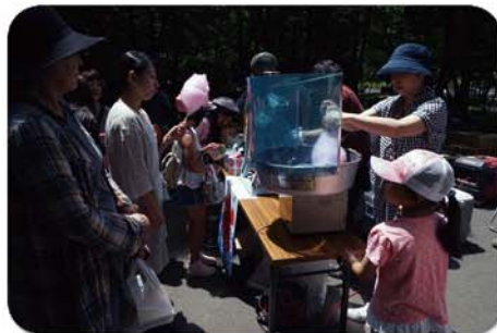
かき氷、綿菓子、ポップコーンの無料配布