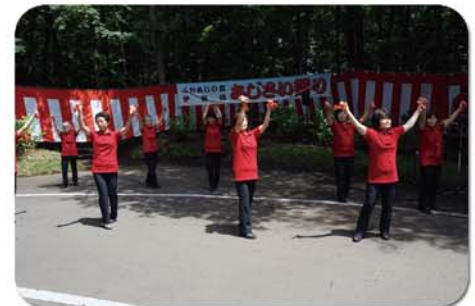
四つ竹タカセ会の皆様