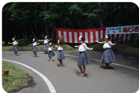
ワイナニ ふらスタジオの皆様