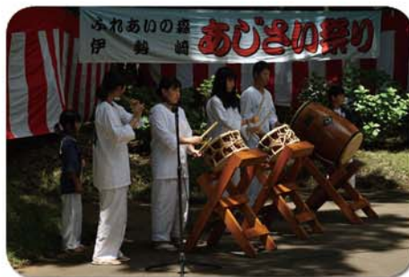
高勢おはやし会の皆様