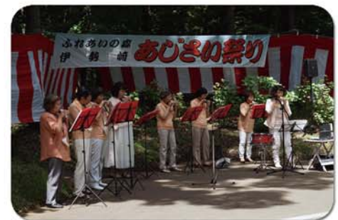
ユ、タンポポの会の皆様