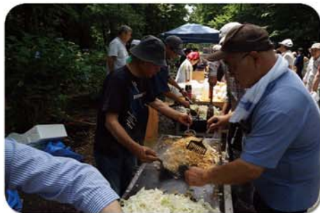
手づくり焼きそばの販売