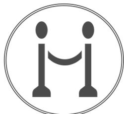
ロープ・チェーン 設置