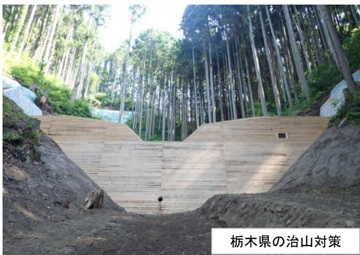
栃木県の治山対策

近年多発する山地災害の減災対策として、栃木県では土砂の流出を防ぐ治山ダムなど予防的なハード対策を計画的に進めています。