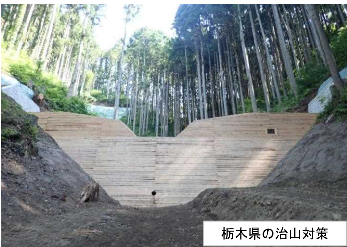
栃木県の治山対策

近年多発する山地災害の減災対策として、栃木県では土砂の流出を防ぐ治山ダムなど予防的なハード対策を計画的に進めています。