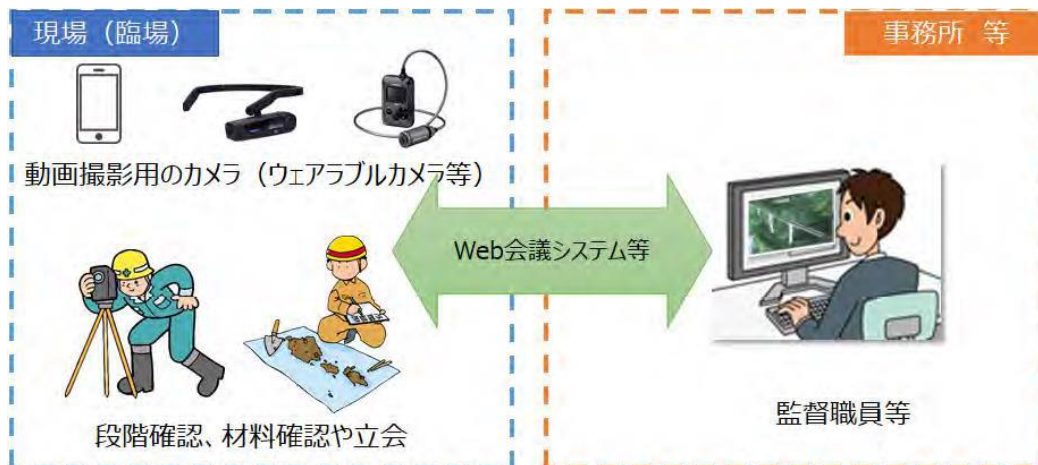
図 2-1 機器構成（例）