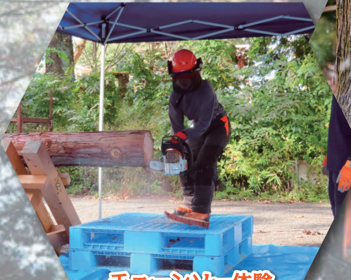
チェーンソー体験