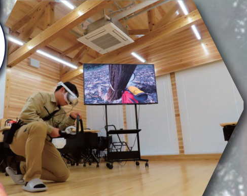
VRシミュレーター (チェーンソー)