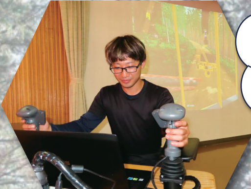
ハーベスタシミュレーター

林業を体感して、 現役のフォレスト ワーカー達に 仕事内容や働き方 を聞いてみよう！