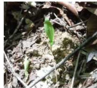
ギンラン（自生個体）