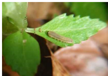
クチナガハバチ類（幼虫）

調査の結果、移殖（植）した里山保全エリア（備中沢）2地点のうち1地点でクチナガハバチ類の幼虫が確認された。