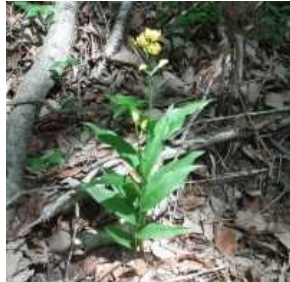
キンラン（移植個体）