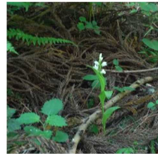
ギンラン（自生個体）