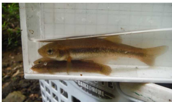
上：アブラハヤ 下：ホトケドジョウ ※種の保護のため、詳細は非公開