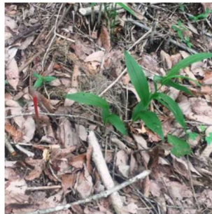
キンラン（移植個体）