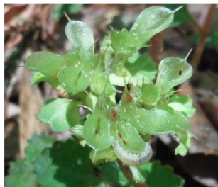
クチナガハバチ類（幼虫）・食草（ネコノメソウ類）

調査の結果、移殖（植）した里山保全エリア（備中沢）2地点のうち1地点でクチナガハバチ類の幼虫（食草含む）が確認された。