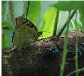
オオムラサキ（幼虫）