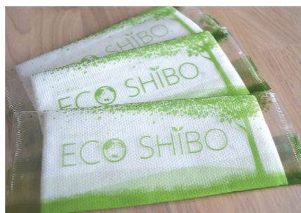
バイオマスプラスチックを使用したおしぼり