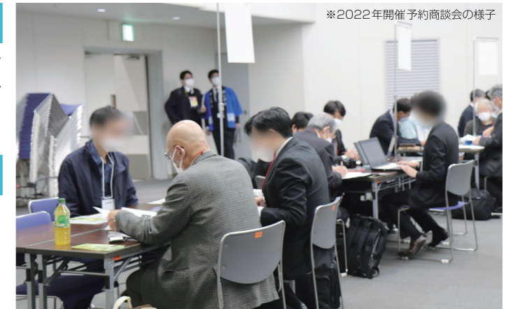
※2022年開催予約商談会の様子

※予約商談は、事前の商談希望調査にもとづきご用意いたします。ご希望通りの商談を組めない場合がありますので、あらかじめご了承ください。