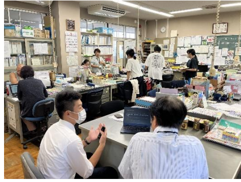
宇都宮市立平石北小学校にて、 周知活動を実施