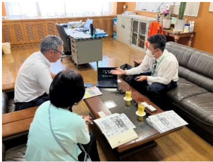
宇都宮市平石中央小学校にて、 周知活動を実施