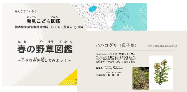
「発見子ども図鑑」 ゴミひろい途中で生えている野草について紹介