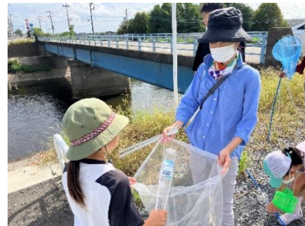
親子でゴミ拾い中、人通りが多い場所には、 プラゴミがいっぱいあることに気がきました！