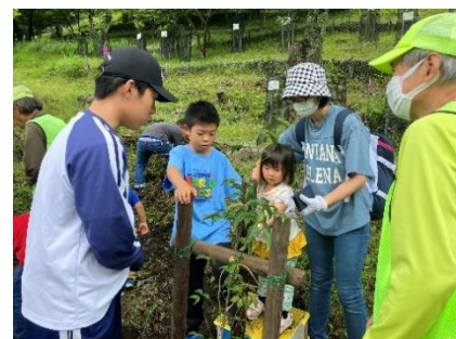
年に2回、公害で今もなお緑がない 日光市足尾地区にて、植樹活動

日々の活動は Facebook ( https://www.facebook.com/npo.tsall.jp ) を是非ご覧ください。