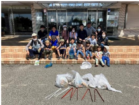
親子、大学生、留学生など 多様な参加者が集合