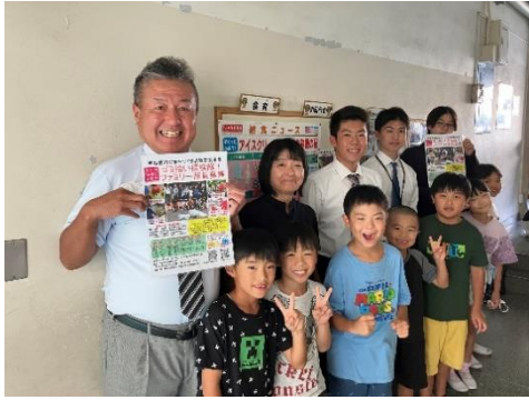
宇都宮市立横川西小学校にて、 ポスター掲示と参加児童と周知活動を実施