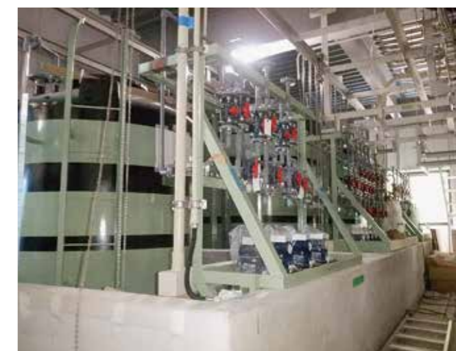
浸出水の汚れを取るための薬品等を貯めるタンク等の設置・調整をしています。