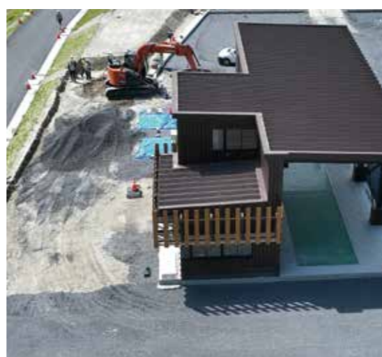
計量施設の仕上げ作業を行っています。