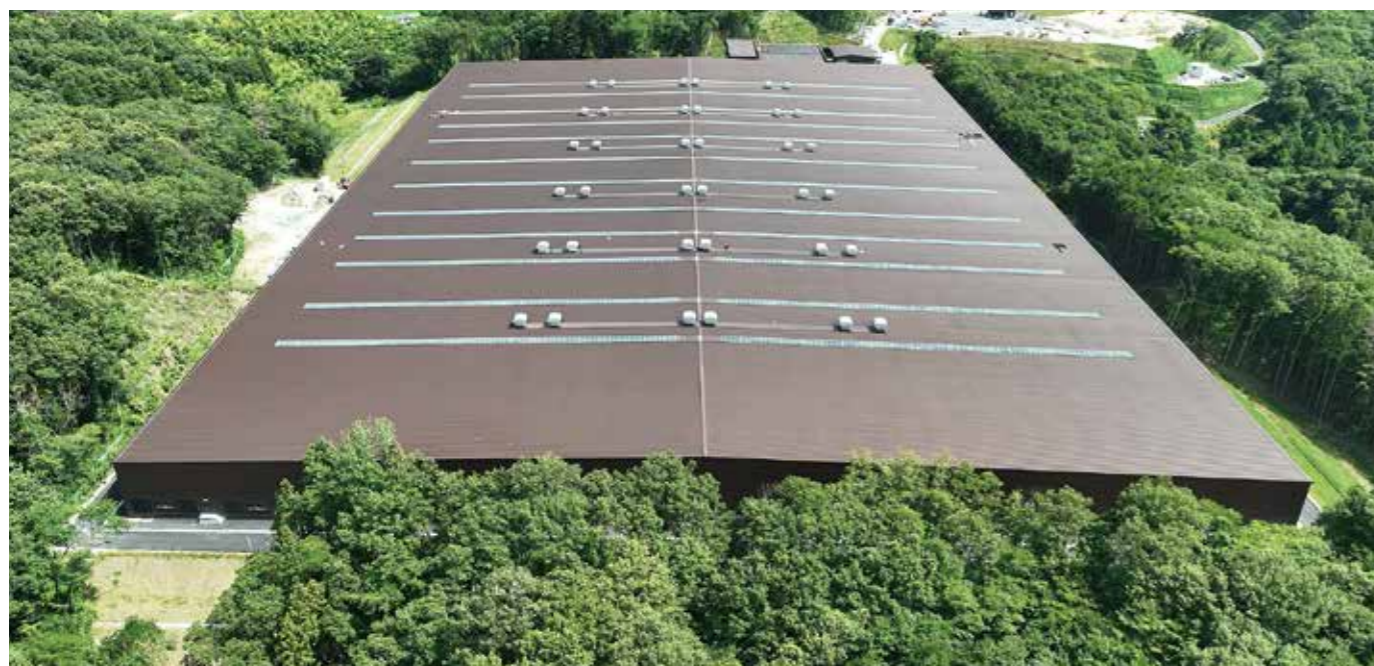
埋立地(被覆施設棟)の全景です。