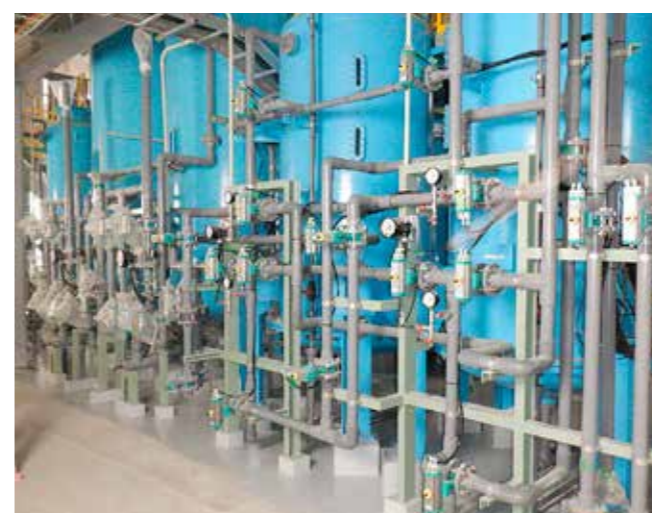
浸出水の汚れを取るための処理プラントの設置・調整を行っています。