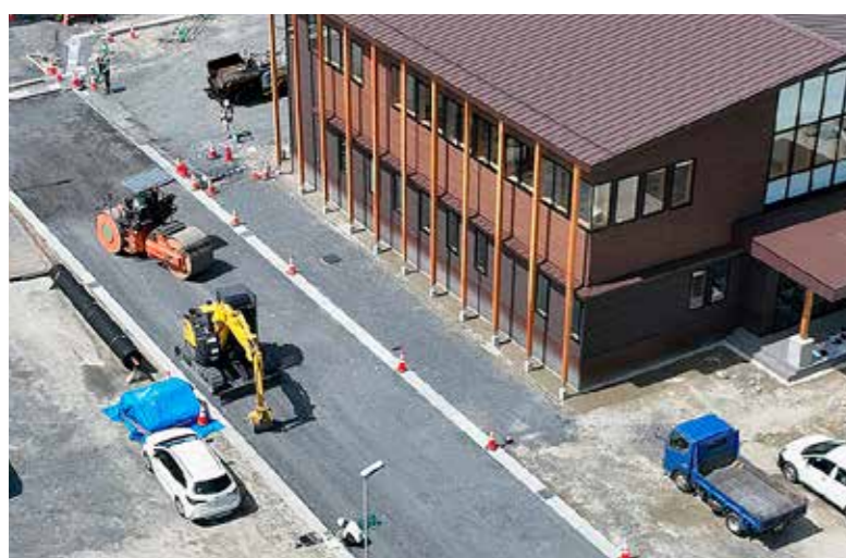
建物周辺の外構舗装・道路舗装を進めています。