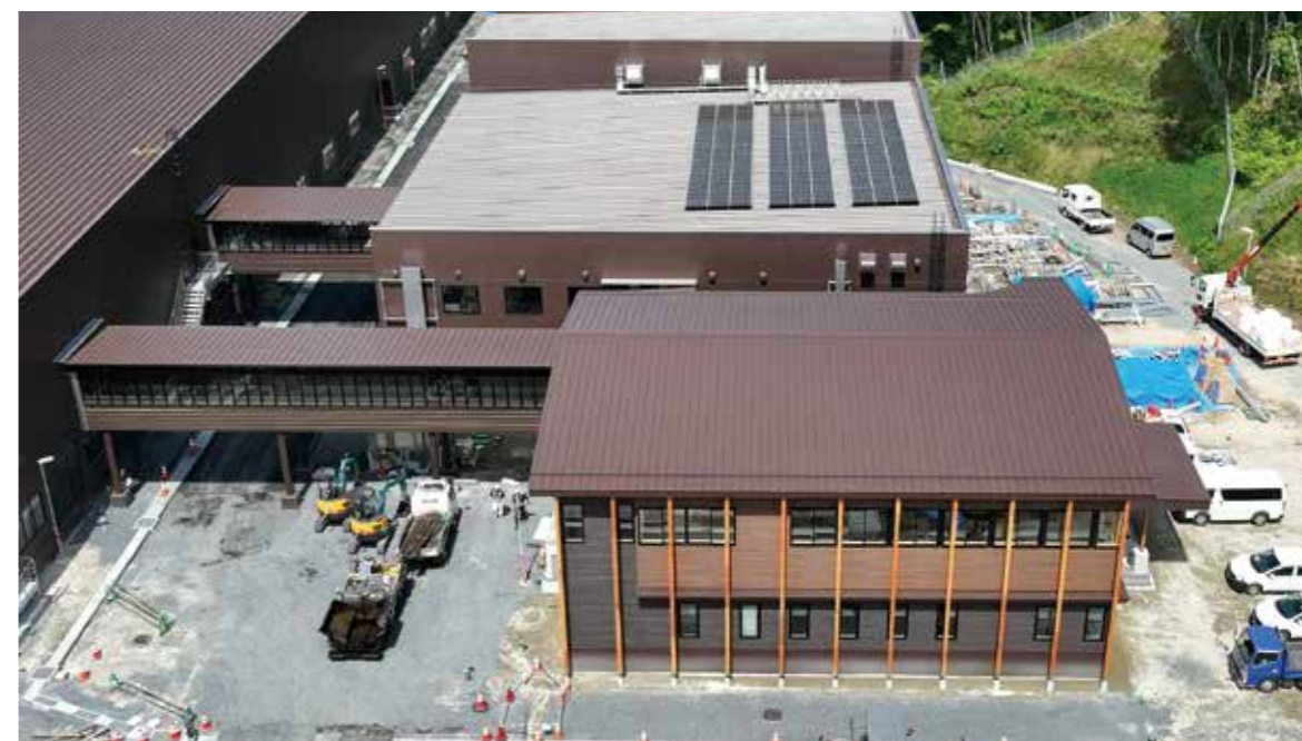
管理棟などの内部仕上げや外構工事を進めています。