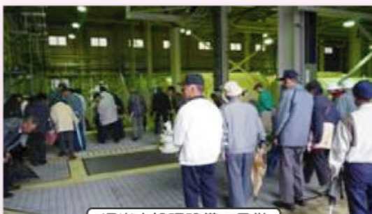
浸出水処理設備の見学