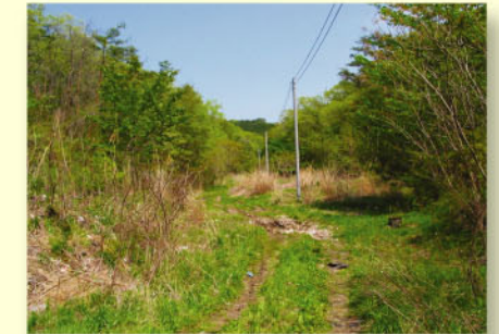
不法投棄現場の様子(平成21年5月撮影)