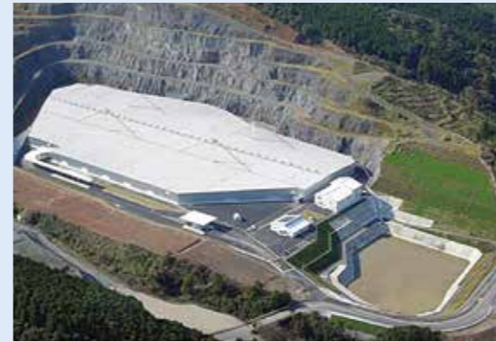
(公財)鹿児島県環境整備公社エコパークかごしま