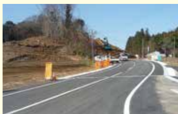
搬入道路工事の状況 (H28.2 末時点)