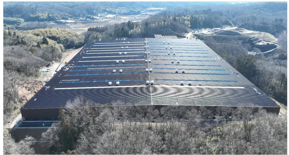
② 埋立地（被覆施設）の全景