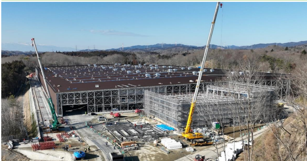
① 埋立地（被覆施設）及び浸出水処理施設の全景