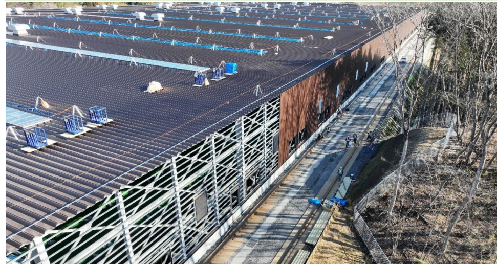
② 被覆施設の外壁工事の状況