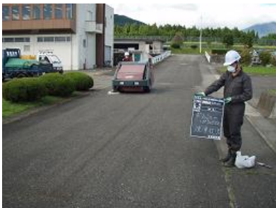
路面清掃による除染状況