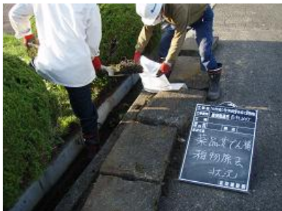
土砂撤去による除染状況