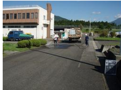
洗浄による除染状況