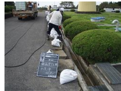
洗浄による除染状況