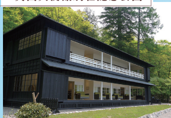
英国大使館別荘記念公園