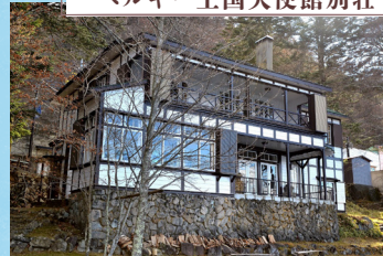
ベルギー王国大使館別荘