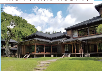
日光田母沢御用邸記念公園