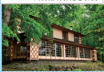
イタリア大使館別荘記念公園