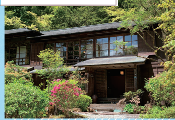
金谷ホテル歴史館