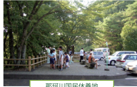
那珂川国民休養地

那珂川国民休養地は八溝山地のほぼ中央部、那珂川を望む高台にあります。那珂川に沿った八溝山地とその周辺は栃木県でも比較的気候の温かな地域で、国見はミカン栽培の北限といわれています。天気の良い日には遠く日光連山や那須連山を眺めることができます。