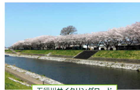
五行川サイクリングロード

蒸気機関車をモチーフにした4階建ての複合施設です。地域の情報の発信拠点となっています。土日や祝日にはSLが走り、多くの観光客でにぎわいます。