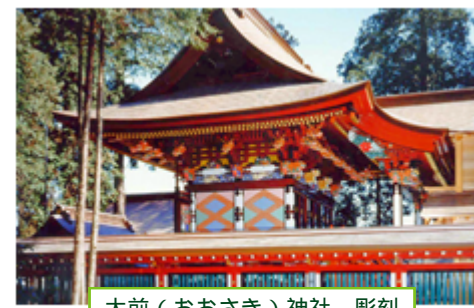
大前（おおさき）神社 彫刻

大前神社は1500年有余の歴史を誇る延喜式内の名社です。御祭神は福の神様、大國様と恵比寿様で、開運招福の願いを叶えてくれる神様です。社殿のいたるところに彫刻がみられ、本殿、拝殿ともに県指定文化財です。