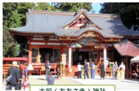
大前（おおさき）神社

芳賀町から真岡市へ向けて五行川に沿った23.1kmのサイクリングロードです。川沿いには多くの桜が植えられ、春には花々が鮮やかに咲き誇り、市民の散歩道となっています。