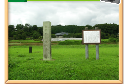
那須官衙（かんが）跡

那須官衙跡は奈良、平安時代の那須国の役所跡です。南北 200m、東西 600mほどの遺跡は溝により 4区画されており、中央ブロックは実務的な官衙、西ブロックは倉庫、東ブロックは郡庁、東南ブロックは館か関連施設とみられています。なお、政庁部分は区画なども判明していません。国指定の史跡になっています。