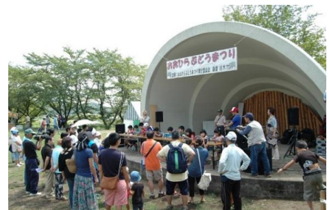
おおひらぶどう祭り