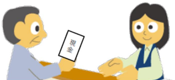
現地で現金支払い

現地係員に現金支払い、もしくはWebで1回分料金を決済 現地係員にて領収書、もしくはWeb購入の購入済みメールやスマホ画面などを提示を 求められた場合には、提示頂く 共通一日券購入者も同様に現地係員に共通一日券購入済みメールを提示