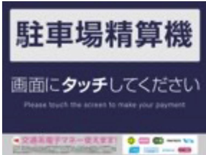
①精算機の画面をタッチ