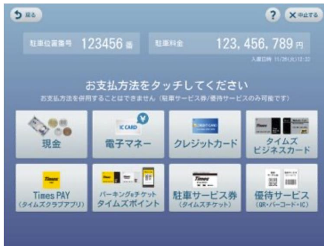
⑤料金が表示されるので、支払い方法を選択