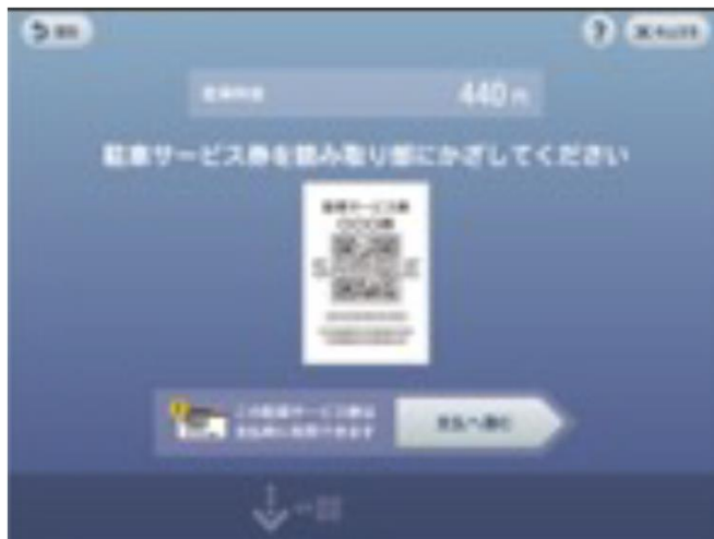
④「支払いに進む」を選択