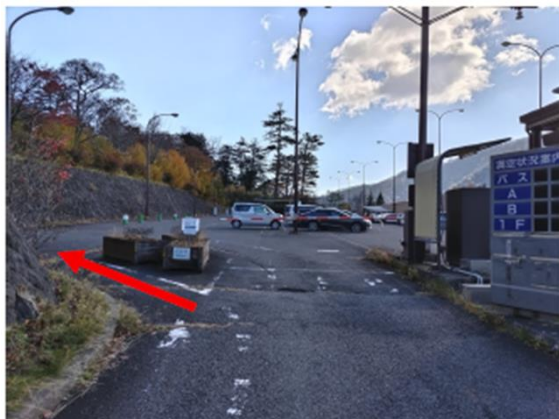
(例) 湖畔第一駐車場

ゲートバーの脇を通過して入場し、指定のスペースに駐車（事前に共通一日券購入者も、1回利用者も）