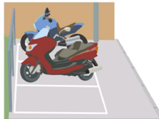
指定のスペースに駐車