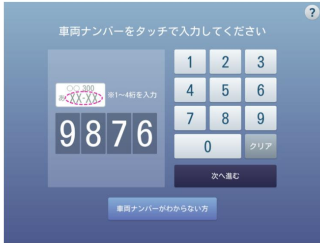
②車両ナンバー（4桁）を入力