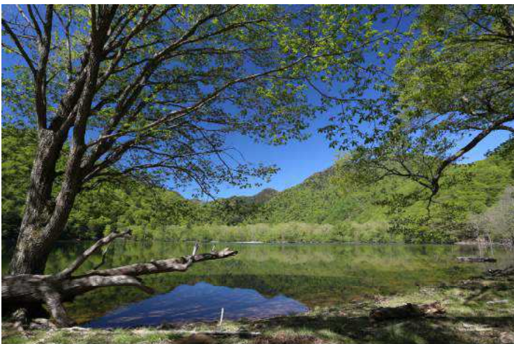
「グリーンエナジー 新緑の候」