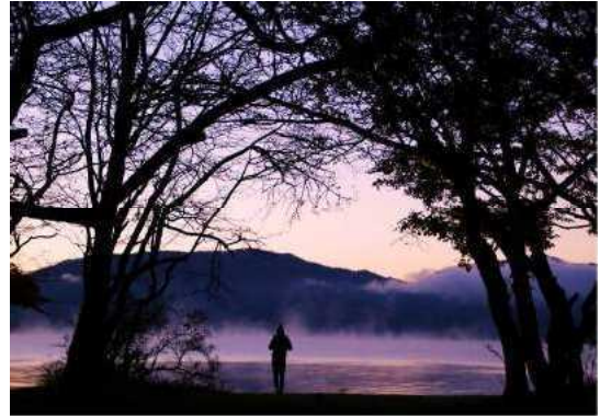
「早朝中禅寺湖絵画」