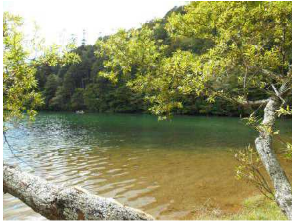
「エメラルドグリーンの湯ノ湖」