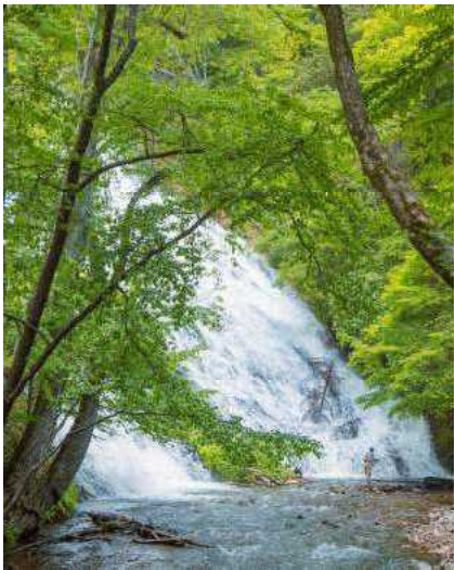
「緑葉に囲まれた湯滝」