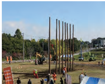
会場には高性能林業機械も展示