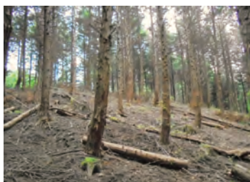
間伐による整備 (日光市)