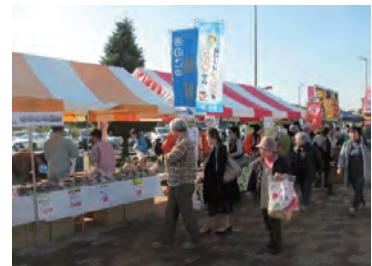
きのご販売や木工教室などのブースが並びました