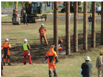
競技会では10名の選手が技術を競い合いました！

このイベントの中で、「とちぎの元気な森づくり県民税」事業のパネル展示や県民税についてアンケートを実施したり、とちもりくんグッズを配布し、訪れた方々に、元気な森づくり県民税の取組についてPRしました。