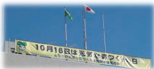
県庁安蘇庁舎（佐野市）