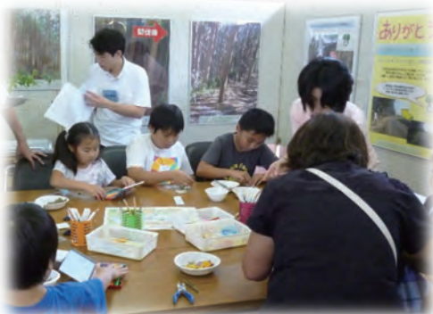
押し花しおりづくり （県林業センター）

多くの方々に工作体験へ参加いただき、さらにパネル展示やPRグッズ、パンフレットの配布をとおして参加者の皆様に「とちぎの元気な森づくり県民税」を活用した「間伐」など、「とちぎの森づくり」について理解を深めていただきました。