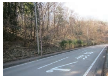
里山林の整備 (那須烏山市)