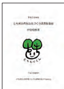
平成28年度評価報告

とちぎの元気な森づくり県民税事業評価委員会において、平成28年度とちぎの元気な森づくり県民税事業の実施状況等について検証・評価が行われ、その結果が報告書として取りまとめられました。