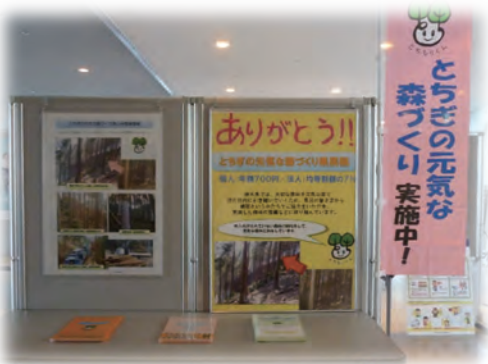
県庁15階展望ロビーの展示