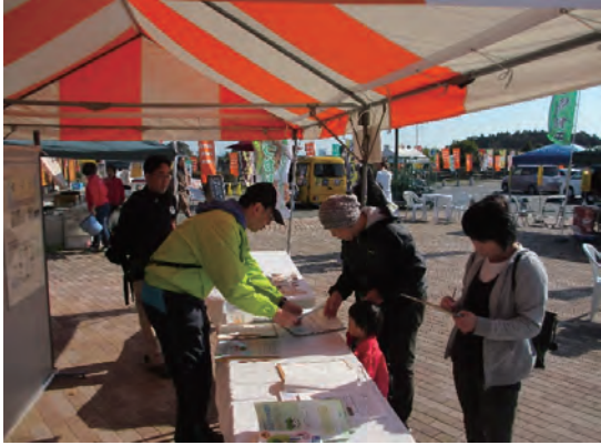
森づくり県民税による取組をPR

10月22日（日）に中止となってしまった、とちぎ林業Grand Prix2017inみぶに代わり、11月5日（日）に伐木技術競技会がみぶハイウェーパークで行われました！