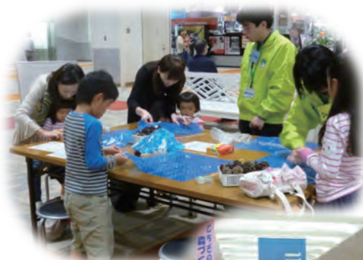
松ぼっくりパラシュート・ 押し花しおりづくり （ベルモール）