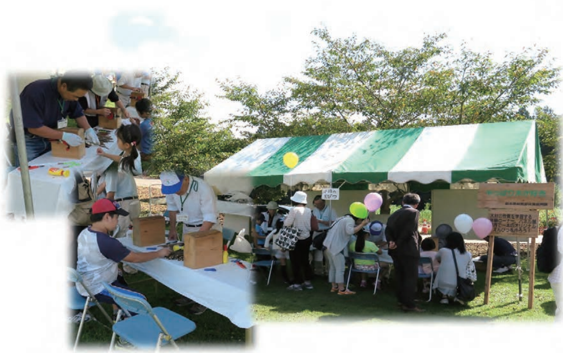
写真:もくもくまつり2017での木工教室 (道の駅うつのみや ろまんちっく村「にぎわい広場」) —とちぎの元気な森づくり県民会議事業—