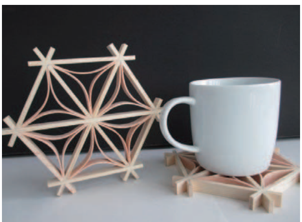
○完成した「鹿沼組子」のコースター 県内で産出された木材（スギ、ヒノキ）で できています。