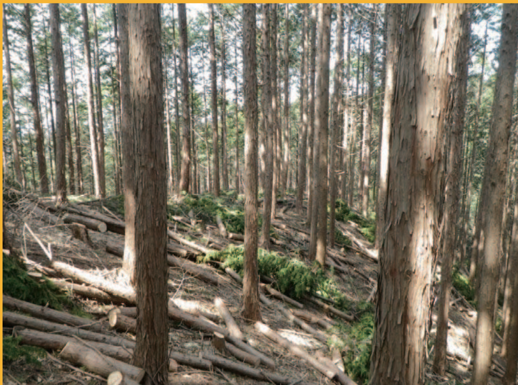
写真：間伐により光が入り林内が明るくなった奥山林 （那須町伊王野地区） —とちぎの元気な森づくり奥山林整備事業—