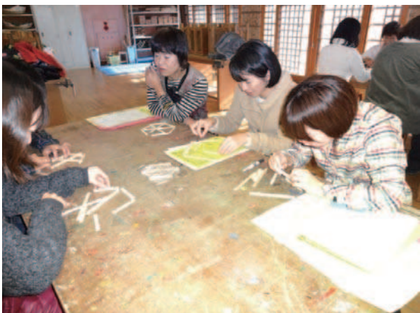
○作り方の説明を聞く前に、まずやってみよう！ 「ここまでできたけど…あれ？」と悩む参加者。

講義の途中、参加者全員におが粉の手浴も体験してもらい、そのあたたかな感触に笑顔いっぱいでした。