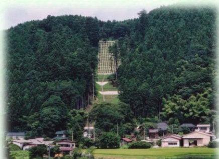
土砂流出防備保安林（那須町）

保安林には、土砂の流出を防ぐ「土砂流出防備保安林」、雨を貯えて洪水や濁水を防ぐ「水源かん養保安林」など、その種類に応じて様々な役割があります。