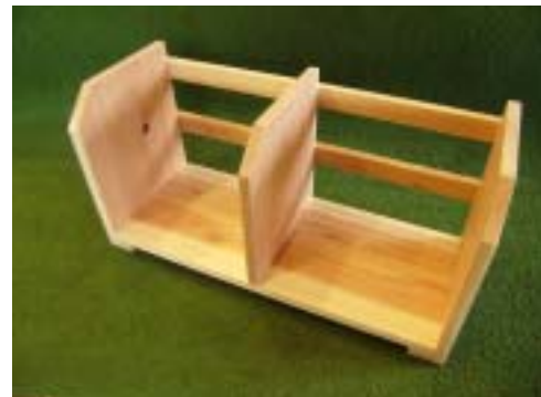
本立てや鉢入れなど子どもたちがつくれる木の教育資材（木工工作材料のセット）を小学校に配布しました。