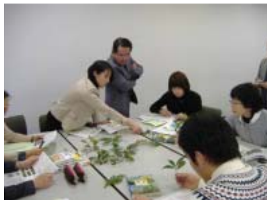
小中学校の先生方の研修会を実施しました。