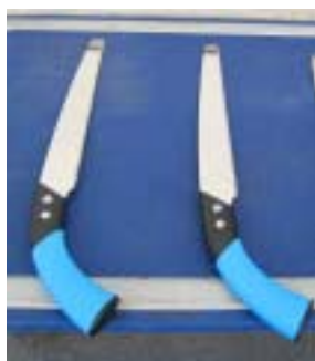
貸出用機材の整備（ノコギリ）

「とちぎの森づくり」ホームページを開設するとともに、「とちぎ森づくり情報センター」を設置し、森林ボランティア会員などへの情報提供や、森づくり活動のための貸出機材の購入、森づくりグループ交流会の開催などを行いました。