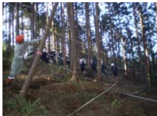
塩谷町立塩谷中学校において、間伐体験学習が実施されました。