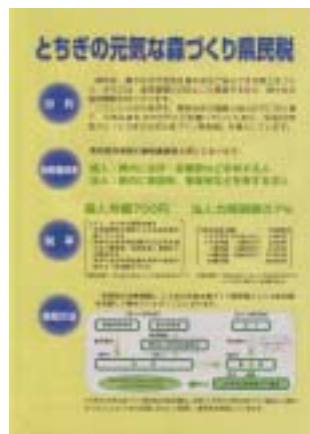
パンフレット（20年度版）

県や市町のイベント等において、パネル展示やパンフレット配布などのPRを行いました。