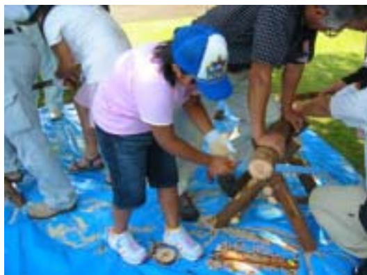
「森の子サミット」で子どもたちが丸太切り体験をしました。

24団体の森林環境学習に助成を行い、指導者研修、緑の少年団交流活動「とちぎ森の子サミット」を開催しました。