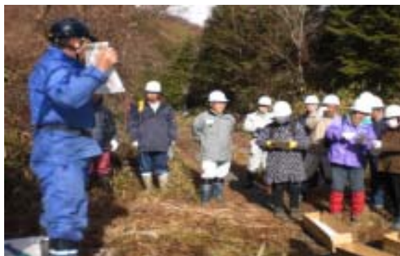
日光市川治地区において、獣害対策活動が実施されました。