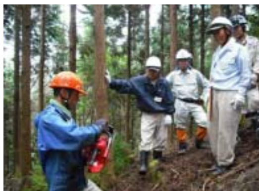
森の手入れ(上級者向け)講座