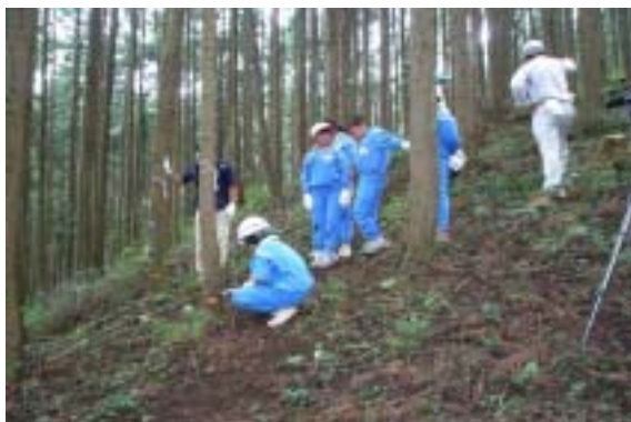
栃木市立寺尾南小学校・寺尾中央小学校において、間伐体験学習が実施されました。