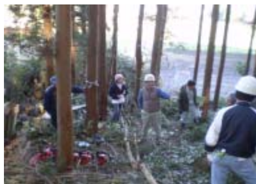
さくら市葛城地区において、森林伐採講習会が開催されました。