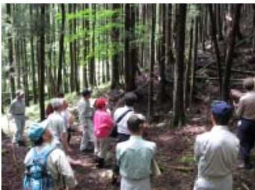
8/27 第2回委員会 日光市において現地調査を実施しました。