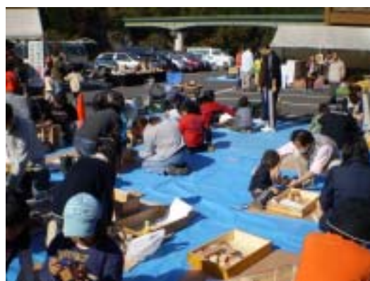
塩谷町「はーとらんど収穫祭」において、木工教室を開催しました。