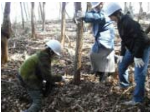
下流域都県民の皆さんが本県で森づくり活動を体験しました。