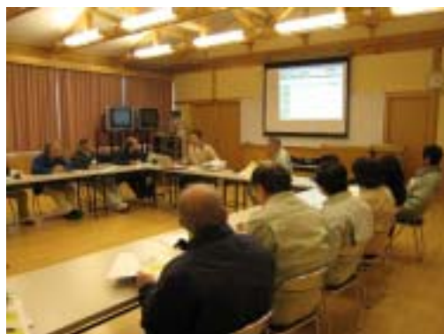
森づくりグループ交流会で意見交換を行いました。