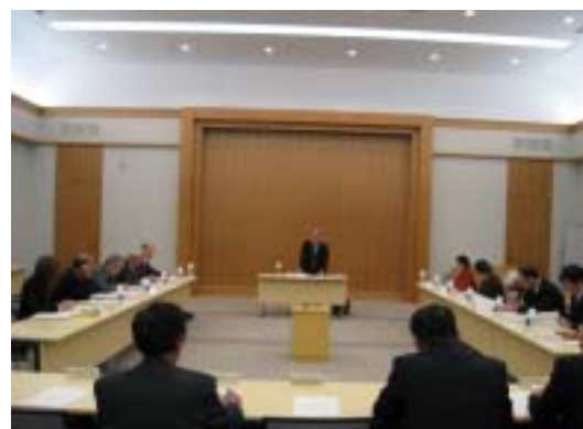
1/23 第4回委員会 有効性・効率性・進捗度の3つの視点から評価を行う手法を決定しました。