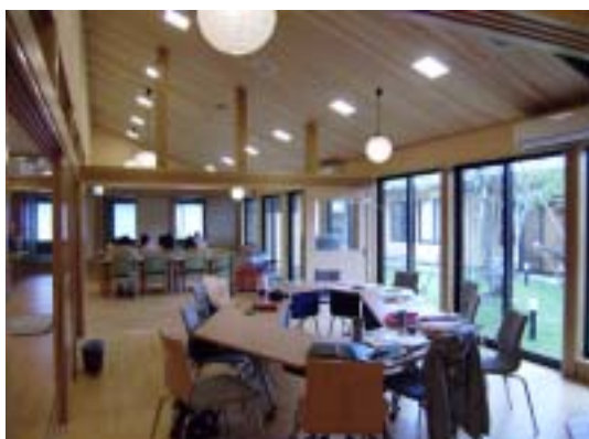
老人福祉施設の木造・木質化を行いました。（高根沢町）