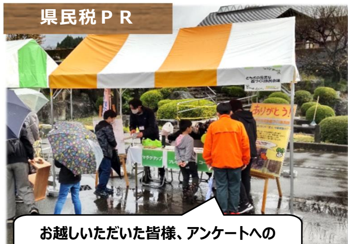
お越しいただいた皆様、アンケートへの御協力ありがとうございました!

また、各ブースでは木工教室や木製品の販売などさまざまなイベントが行われ、あいにくの雨にもかかわらず多くの家族連れなどでにぎわいました。