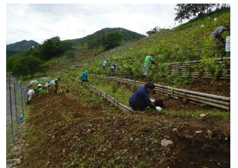
NPO法人足尾に緑を育てる会 3~11月の第3土・日曜日に活動を実施しています。植樹の準備（苗木の仕分け、堆肥づくり）植樹地の下刈り等