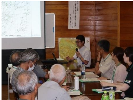
研修第1回 里山の地域特性等に関する講座

研修は全6回で、今年度は、里山の特性や里山林の管理・利用を学ぶ講座、刈払機やチェーンソーの安全な使い方を習得する実習、竹林の利活用体験などを行っています。