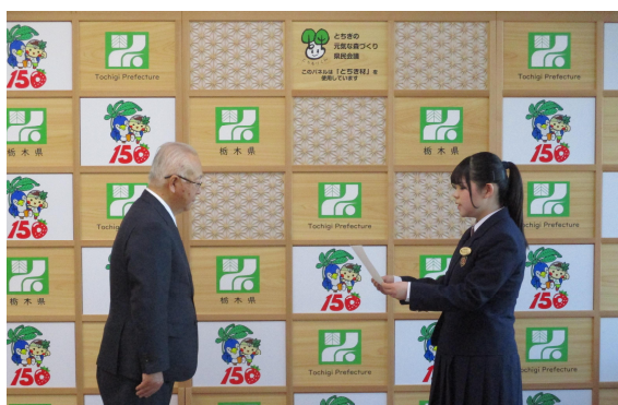
1日環境森林部長としてとちぎの元気な森づくり基金への寄附者に礼状を贈呈