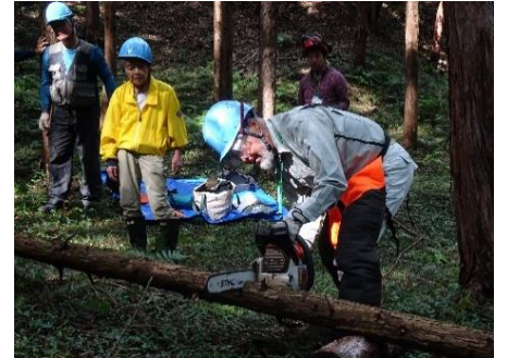
研修第3回 チェーンソー操作体験