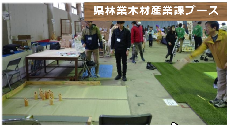
県林業木材産業課ブース