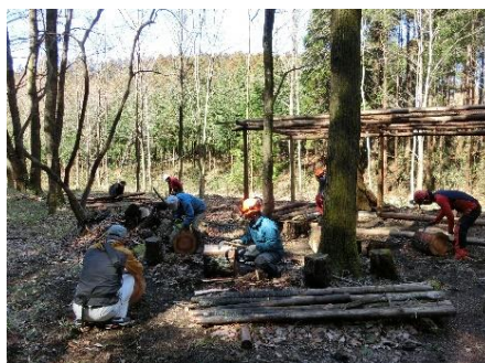
くまの木里山応援団 毎月第3日曜日に定例活動を実施しています。下刈り、枝打ち、除伐等の見学および危険でない作業等