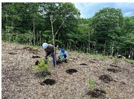
那須里山を育てる会 6、10月にクヌギ・コナラの植栽、下刈り、ドングリまきを実施しました。

サポーター会員に御登録いただいた方には、ボランティアを必要としている活動主催者の森づくり活動情報を提供するほか、活動のマッチング等を行います。