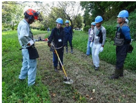
研修第2回 刈払機操作体験