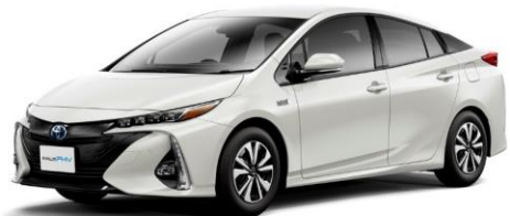
▲トヨタレンタリース栃木