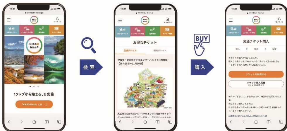
▲日光地域の交通と観光コンテンツをワンストップで検索・購入(イメージ)

また、EV・PHV カーシェアや急速充電器の設置などにより渋滞緩和やCO2削減を図る、日光地域の環境にも配慮した国内初の環境配慮型・観光 MaaS です。