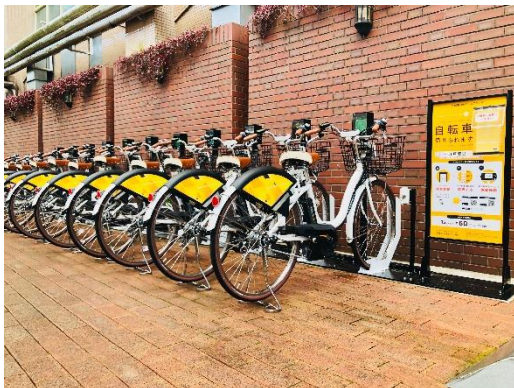
▲ハローサイクリング