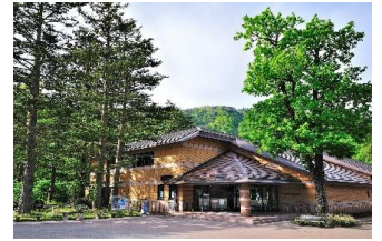
栃木県立日光自然博物館

※詳細は「NIKKO MaaS WEB サイト」 ( https://www.tobu-maas.jp/lp ) をご確認ください。