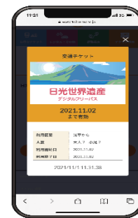
▲デジタルフリーパス（イメージ）

ご旅行の目的（歴史・文化・伝統・自然等）や場所に合わせ、より使い易く、よりお得にご利用いただくことができる4種類のデジタルフリーパスを購入できます。従来の企画乗車券と比べ、より細かいニーズに合わせたフリーパスを購入できるほか、特典協賛店舗が約50店舗に増え、日光・鬼怒川エリアをこれまで以上にお楽しみいただけるようになります。