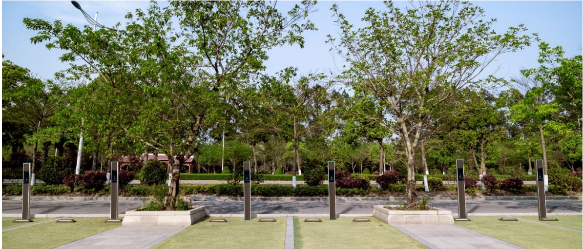
▲ EV・PHV 充電器設置風景