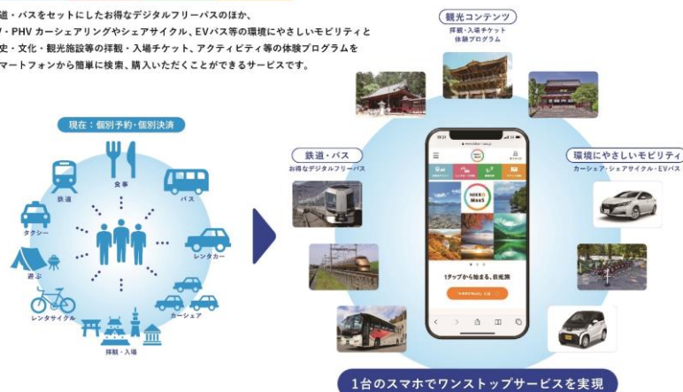
▲NIKKO MaaSのサービス概要（イメージ）

鉄道・バスをセットにしたお得なデジタルフリーパスのほか、EV・PHV カーシェアリングやシェアサイクル、EVバス等の環境にやさしいモビリティと歴史・文化・観光施設等の拝観・入場チケット、アクティビティ等の体験プログラムをスマートフォンから簡単に検索、購入いただくことができるサービスです。