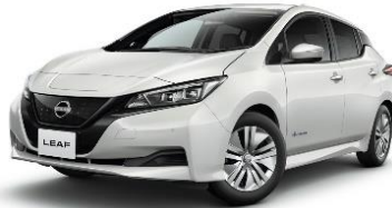
▲オリックス自動車