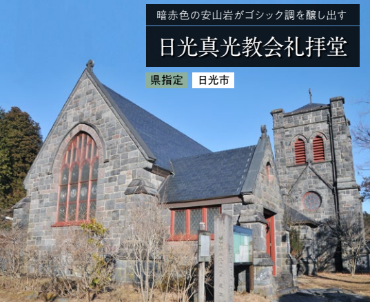
暗赤色の安山岩がゴシック調を醸し出す 日光真光教会礼拝堂 県指定 日光市