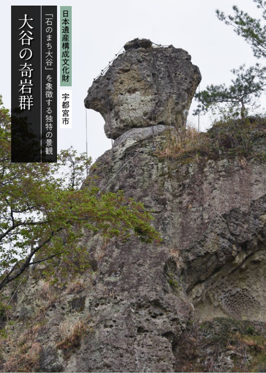
日本遺産構成文化財 宇都宮市 「石のまち大谷」を象徴する独特の景観 大谷の奇岩群