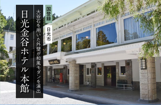
国登録 日光市 大谷石を用いた外壁が和風モダンを演出 日光金谷ホテル本館