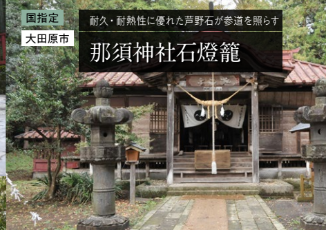
国指定 大田原市 耐久・耐熱性に優れた芦野石が参道を照らす 那須神社石燈籠