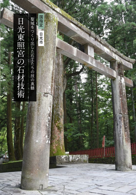
国指定 日光市 聖域をつくり出した石工たちの技の真髄 日光東照宮の石材技術