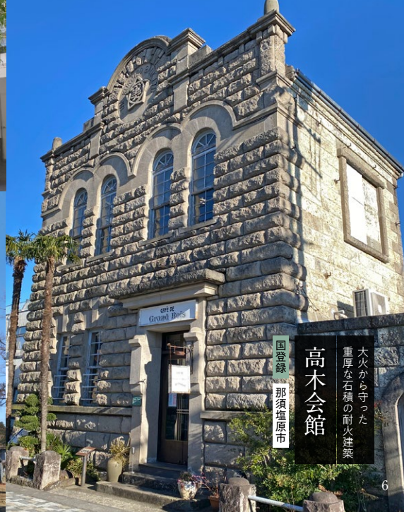
国登録 那須塩原市 大火から守った 重厚な石積の耐火建築 高木会館