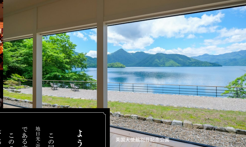
英国大使館別荘記念公園