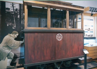
那須人車軌道復元客車

人力で客車と貨車を押し て運行した「人車鉄道（軌 道）」。明治時代後期に登場 し昭和初期まで使われ、栃 木県は全国有数の人車鉄 道の路線を有していました。 その歴史と役割について ご紹介しています。