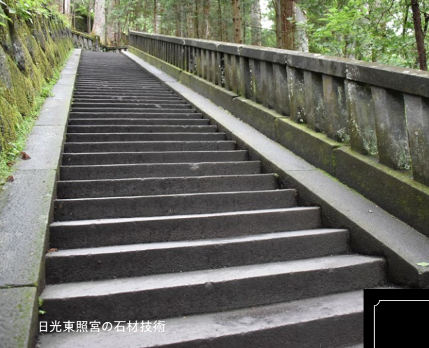
日光東照宮の石材技術