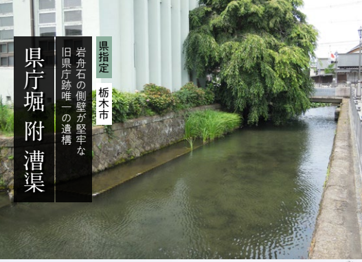
県指定 栃木市 岩舟石の側壁が堅牢な 旧県庁跡唯一の遺構 県庁堀附漕渠