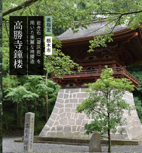
県指定 栃木市 岩舟石（凝灰岩）を用いた美麗な袴腰造