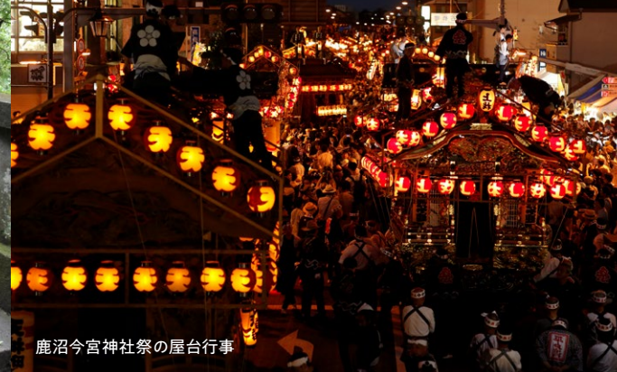
鹿沼今宮神社祭の屋台行事