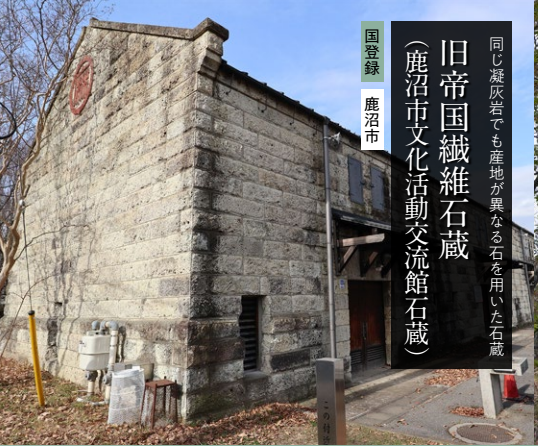
国登録 鹿沼市 同じ凝灰岩でも産地が異なる石を用いた石蔵 旧帝国繊維石蔵 (鹿沼市文化活動交流館石蔵)