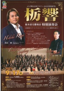
昨年度の公演から