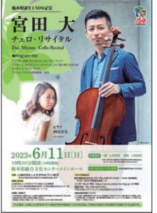
過去の公演から 第7回 (弦楽器) 最優秀賞 宮田大