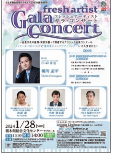
昨年度の公演から ※今年度は2025年1月26日サブホール開催予定