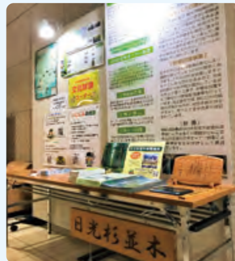
◇県立博物館での出展ブース