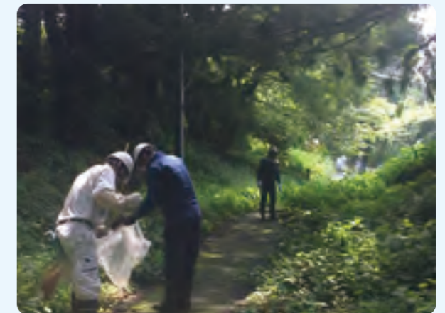
◇ゴミ拾い活動の様子◇