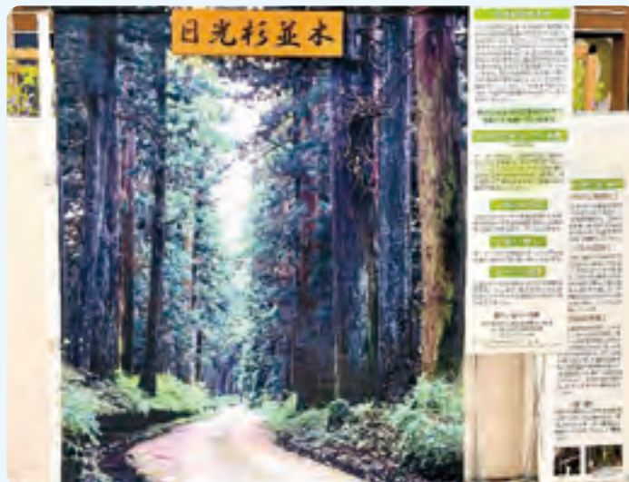
◇イオンリテール(株)主催「第8回栃木県フェア」でのパネル展示

日光杉並木街道保護の大切さや、杉並木の魅力を伝えるため杉の並木守事業などについて、PR活動を行いました。