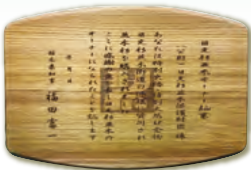
◇オーナー証書レプリカ◇