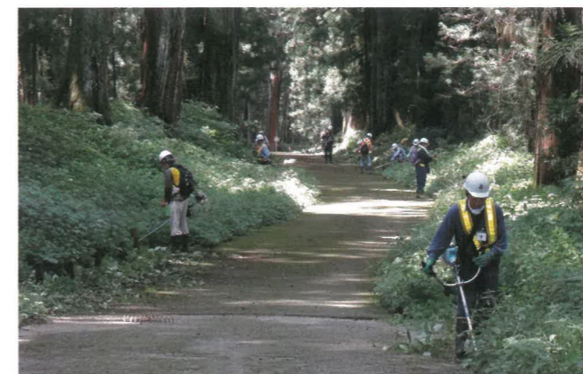
活動の様子(下草刈り)

「杉の並木守」(日光杉並木街道保護ボランティア)の活動を希望される方には、「杉の並木守」の活動に必要な知識や技術を習得するため、日光杉並木街道に関する講座や現地研修を受講していただけます。受講後、いくつかのグループに分かれ日光杉並木街道の下草刈りや清掃活動などの保護ボランティア活動を行っていただきます。