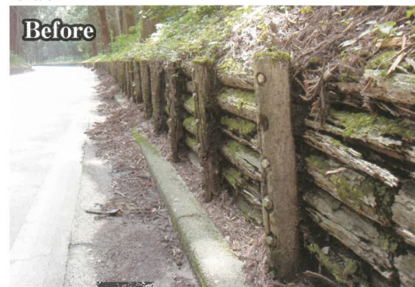
設置後10年以上が経過し、腐食等が激しい木柵を対象に改修を実施。