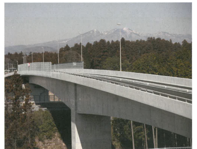
板橋バイパス 国道121号（例幣使街道）の交通量が減少し、日光杉並木の保全に寄与すると期待される。

栃木県では、杉並木街道周辺の開発を防ぎ、並木杉の生育環境を恒久的に保全するため、杉並木街道の両外側概ね20mの範囲の土地を取得する「杉並木保護用地公有化事業」を実施しています。