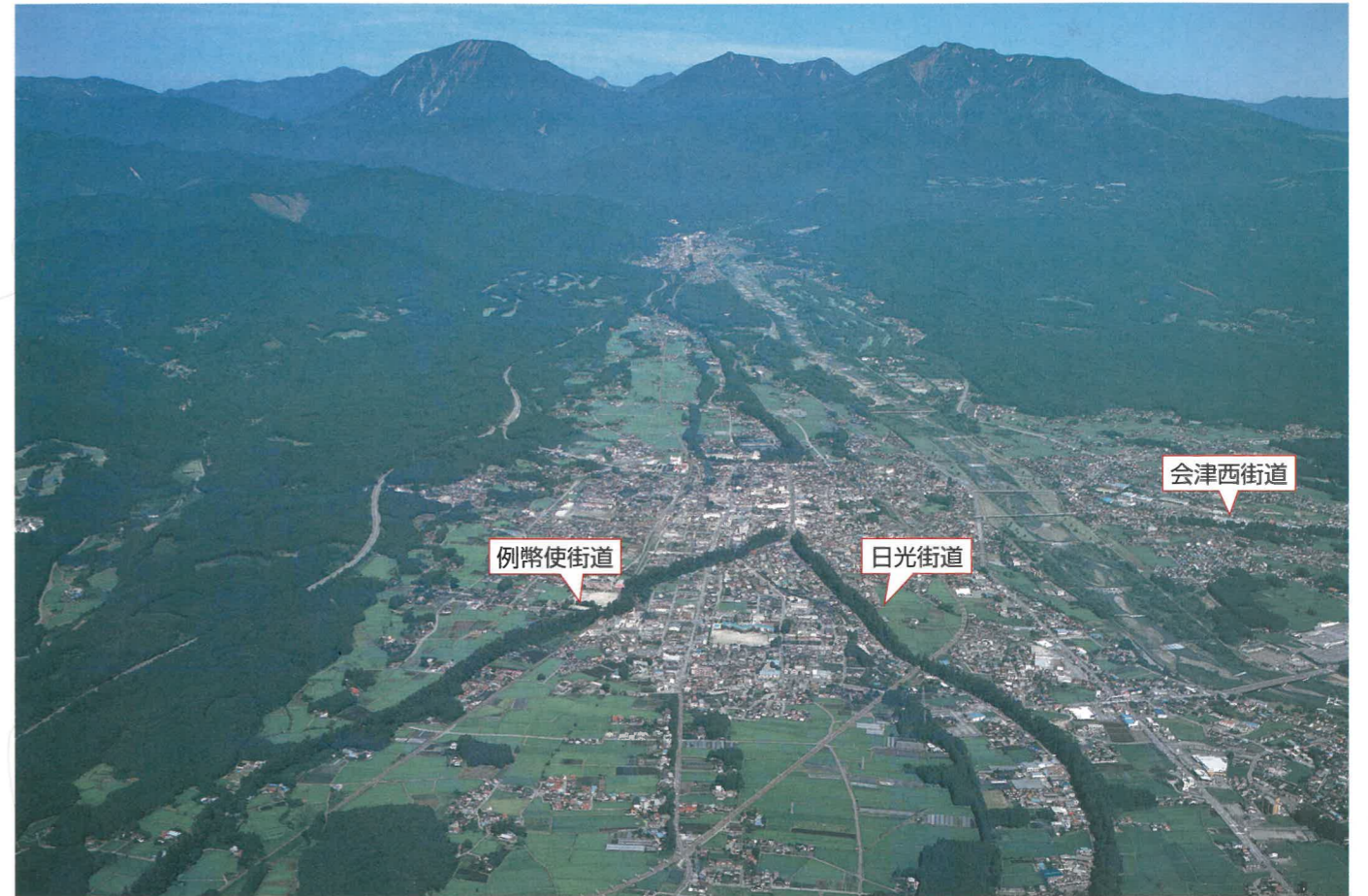
日光杉並木と日光連山

杉減少の原因には台風などの自然災害や杉自身の老齢化もありますが、他に通過交通量の増加や街道周辺の開発などによる杉の生育環境の悪化をあげることができます。