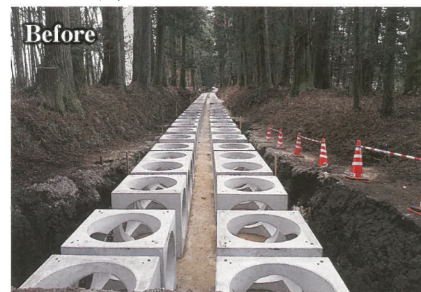
中空コンクリートブロック(ポカラ)を用いることにより、空洞内の土が固まらず杉の根が広がるスペースを確保できる。