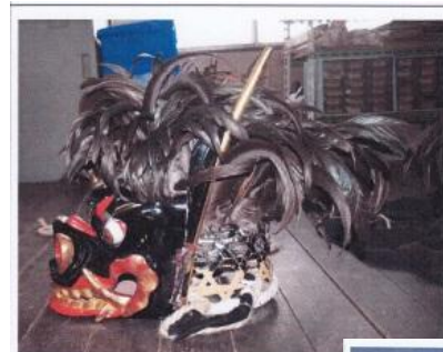
修理前 (太夫獅子・左側面)