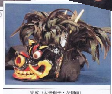
完成 (太夫獅子・左側面)