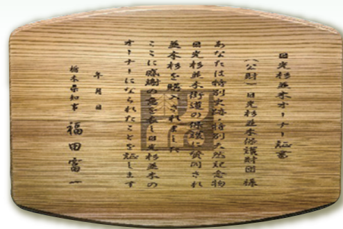
◇オーナー証書レプリカ◇