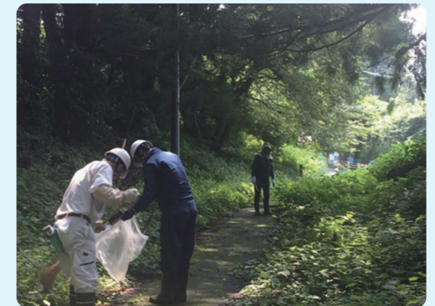
◇ゴミ拾い活動の様子◇