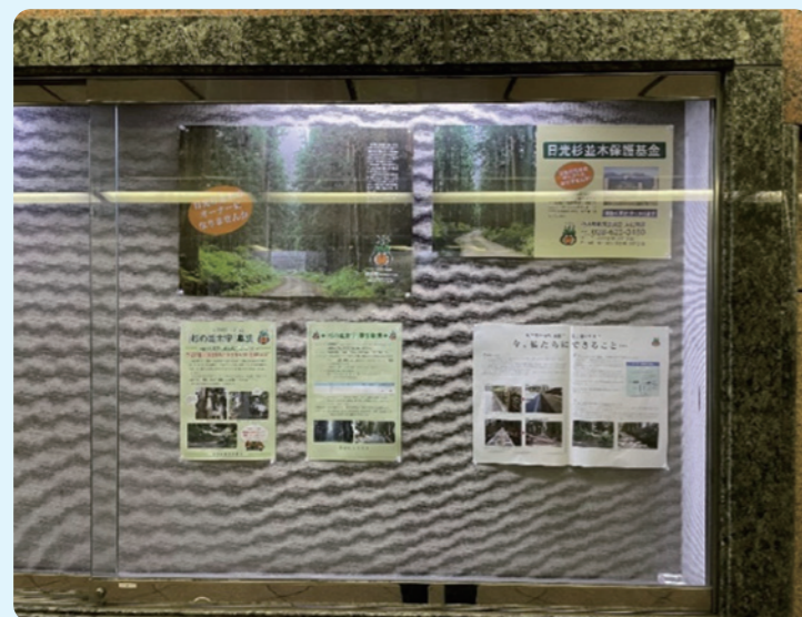
◇本町地下道横断歩道内での広告展示◇

日光杉並木街道保護の大切さや、杉並木の魅力を伝えるため杉の並木守事業などについて、PR活動を行いました。