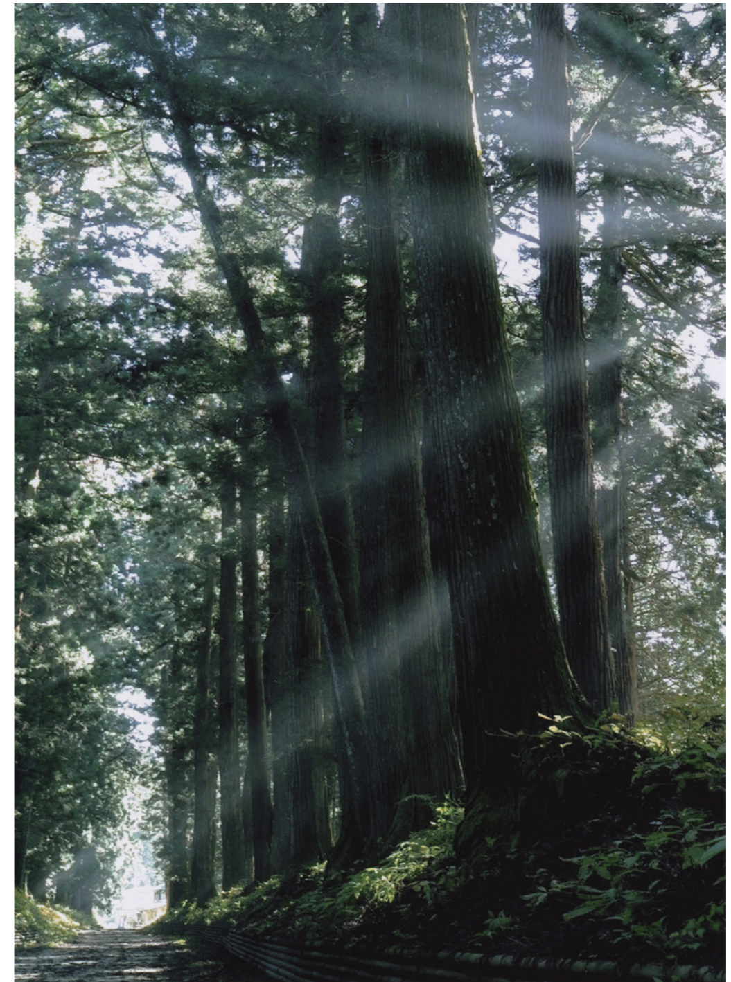
2011年日光フォトコンテスト日光杉並木賞作品「幽径」