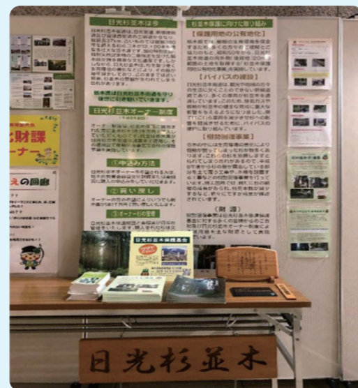
◇県立博物館での出展ブース◇