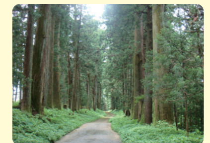
◇日光杉並木街道の風景◇