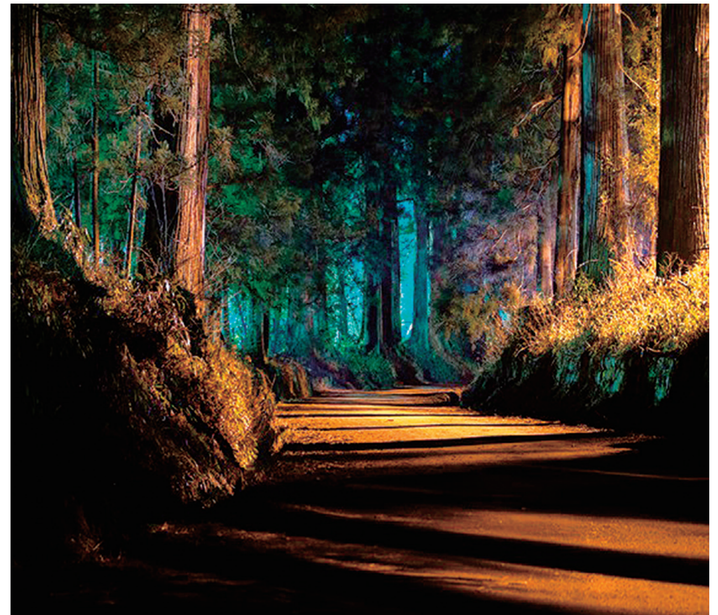
2018日光フォトコンテスト日光杉並木賞受賞『杉並木・夜の顔』