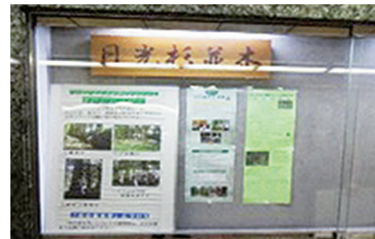
◇本町地下道横断歩道内での広告展示◇