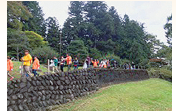
◇日光杉並木清掃活動の様子◇