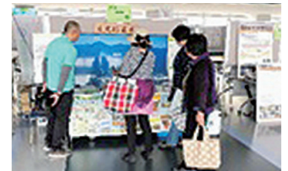
◇栃木県民の日記念イベント◇ (本館15階)