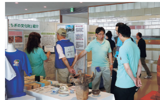
（宇都宮市 平成25年10月5日）