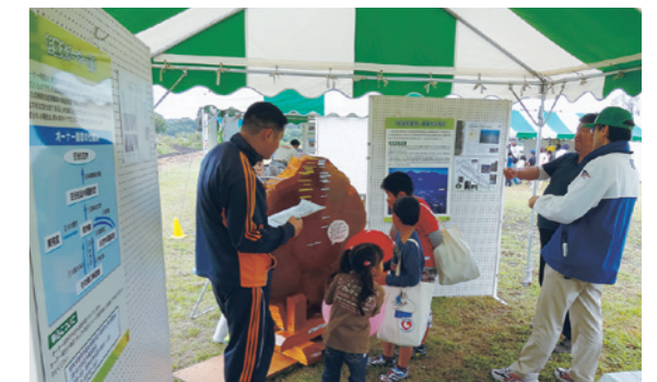
（宇都宮市 平成25年6月15日）