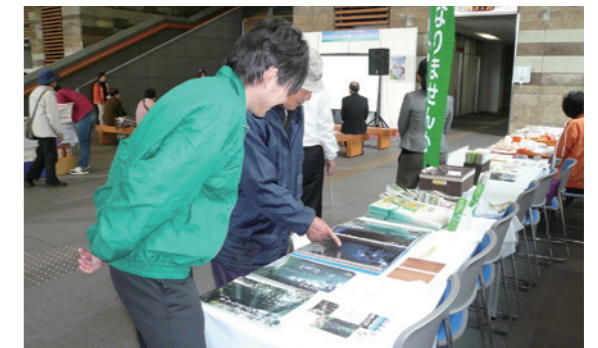
（宇都宮市 平成24年11月13日）