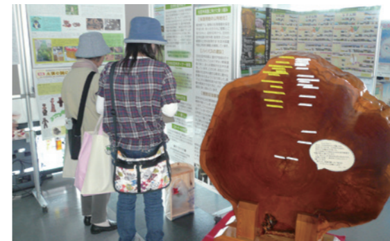
（宇都宮市 平成24年6月15日）