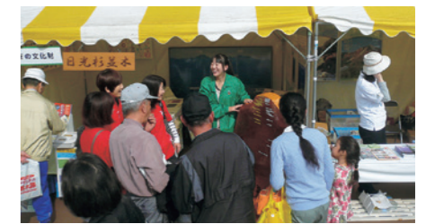
スポレク「エコとちぎ」