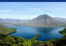
男体山と中禅寺湖