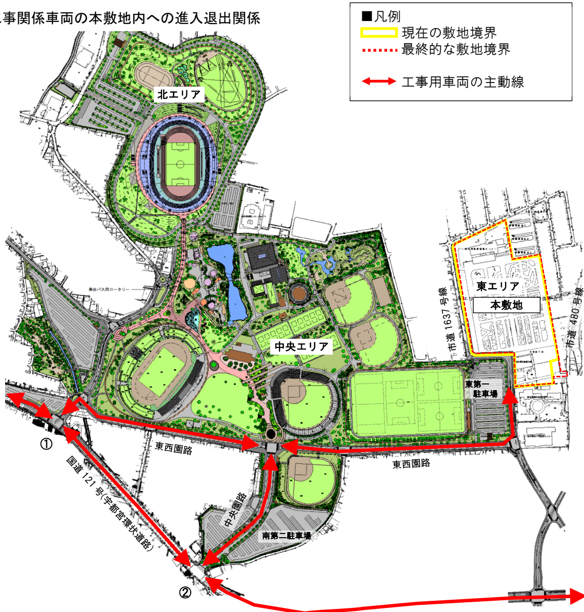
総合スポーツゾーン公園基本設計平面図

※ 工事関係車両は、国道 121 号（宇都宮環状道路）の①又は②交差点を利用し、園路（東西遠路・中央園路）、市道 1637 号線を経由の上、本敷地に進入退出すること。