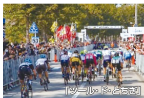
「ツール・ド・とちぎ」