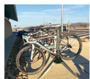
▲サイクルスタンド