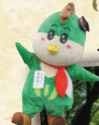
野岩鐵道キャラクター「やがびい」