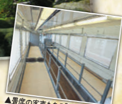
▲畳席の客車もある「やがびいカー」