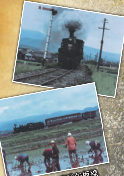
▲隣線前の東武矢板線 (写真上下:1959年)

世界中の有名な建築物を25分 の1サイズで再現。愛するわん ちゃんも一緒に、家族みんなで小 さな世界一周旅行に出掛けよう！ Tel.0288-77-1000(東武ワ ールドスクウェア)