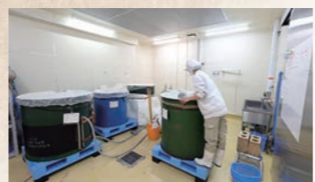
清潔で誰もが動きやすい職場